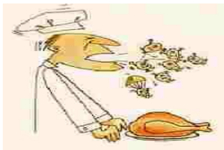
Contaminacion biologica, física, química

De acuerdo a la explicación realizada por la instructora sobre las enfermedades de transmisión alimentaria (ETAS). Consulte en páginas de internet el estudio de dos casos: infecciones e intoxicaciones de los alimentos. Para ello tenga en cuenta el sitio, la fecha, cantidad de personas involucrada (30 como mínimo), síntomas, alimentos que ocasionan la enfermedad y acciones que toma salud pública ante la emergencia. Socialice en plenaria